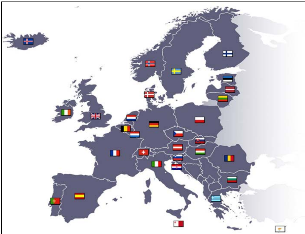
Mapa de las universidades nacionales de formación policial de los Estados miembros de la UE y los países asociados