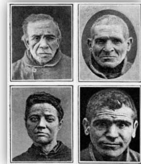
Imágenes del Atlas criminal de Lombroso 1