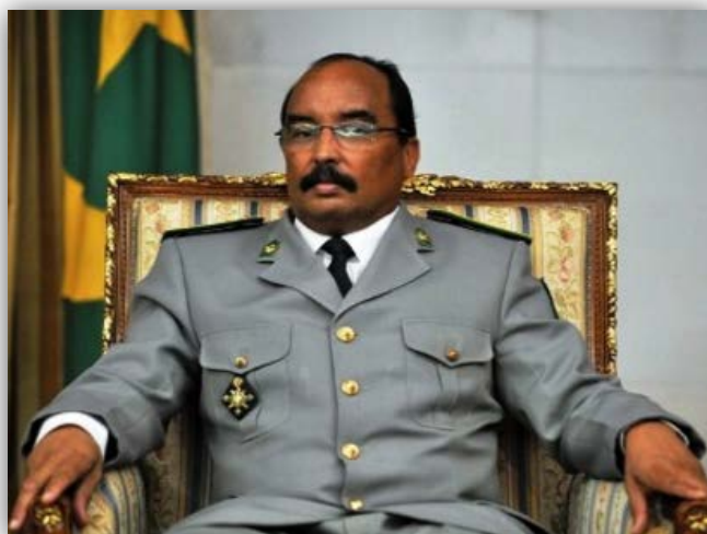
Mohamed Ould Abdelaziz

cargo presidencial durante cinco años más (según la Constitución solo se permiten dos mandatos por candidato). La segunda posición la logró Biram Dah Abeid, del partido Iniciativa del Resurgimiento Antiesclavista (encarcelado desde noviembre del 2014 y sentenciado a dos años en 2015 por rebelión y desacato a la autoridad cuando protestaba contra la reforma agraria en el sur de Mauritania).