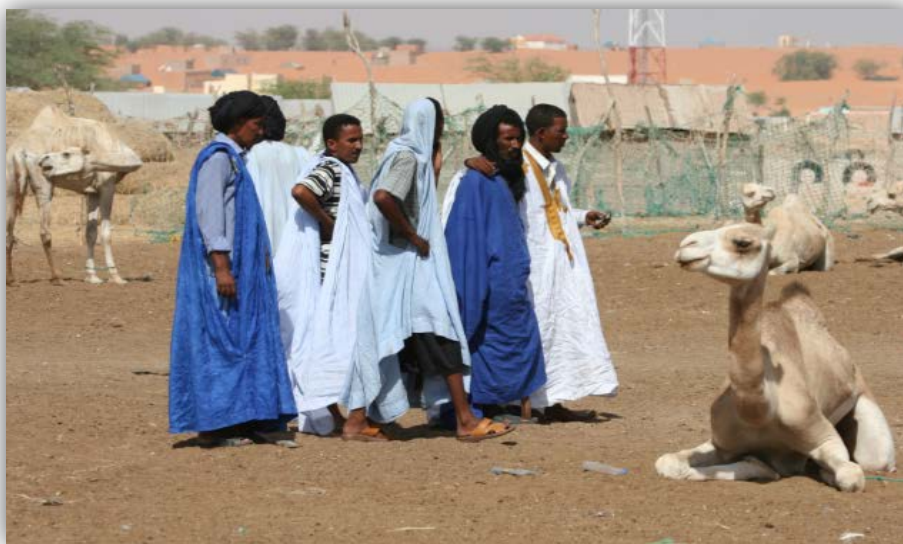
Población mauritana vestida de manera tradicional

En el interior de Mauritania se sitúa la frontera que divide el África blanca del África negra. El norte desértico ha sido habitado tradicionalmente por la población mora, mientras que en la zona sur cercana a la cuenca del río Senegal ha sido poblada por población negro-africana. Los primeros, con una cultura y lengua (hassaniya) muy similar a la de los saharauis, proceden del mestizaje de las tribus árabes y beréberes. En torno a este grupo también existe una población negra, normalmente con un rango social inferior, también arabizada. La población negro-africana del sur del país ha mantenido la lengua y la cultura de sus propios grupos sociales (soninke, fulani y wolof). El punto de unión entre toda la población es el islam sunní en su vertiente malikí. Ambos grupos tradicionalmente han tolerados las prácticas esclavistas, fenómeno que aún hoy sigue latente en la sociedad mauritana. En la actualidad se estima que el 70% de población es mora (20% moros blancos y 50% moros negros) y el 30% restante, negro-africana 10 .