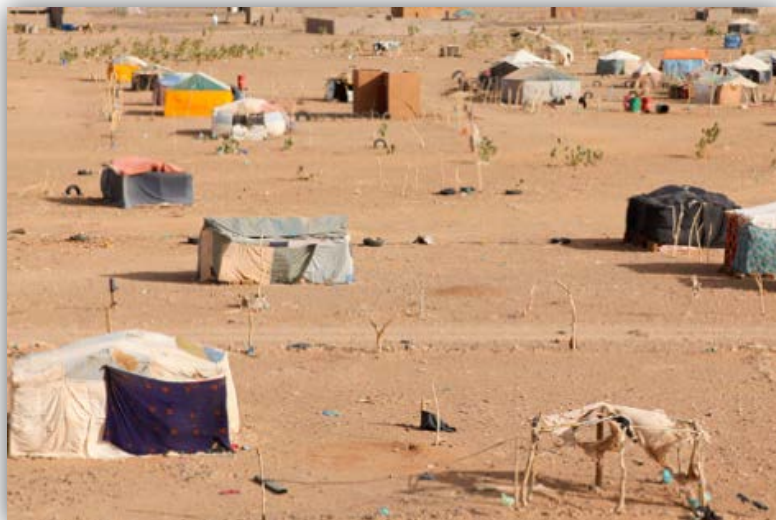
Población rural en Mauritania

El nuevo estado nació con algunas dificultades: la falta de una identidad nacional bien construida (división entre población mora y negro-africana) y las reivindicaciones marroquíes sobre este territorio (que duraron hasta los años 70). Cuando Marruecos alcanzó su independencia en 1946, reclamó sus derechos sobre el Sáhara Occidental y Mauritania (reivindicación en torno a los partidos nacionalistas árabes). Esta pretensión fue contestada rápidamente por la población negra de las inmediaciones del río Senegal que fundó su propio partido político, el Bloque Democrático del Gorgol 11 . En este inestable contexto, Ould Daddah fue reelegido varias veces presidente del país y emprendió políticas muy polémicas como la arabización de la enseñanza en 1966. De esta manera, la población negro-africana que había recibido una educación en francés en los tiempos coloniales se veía excluida del poder. Con el paso del tiempo Ould Daddah evolucionó hacia posturas más autoritarias hasta crear un único partido político legal en 1961, el Partido del Pueblo Mauritano. A través de este partido, Ould Daddah mantuvo un férreo control del estado que duró hasta el golpe de estado de 1978.